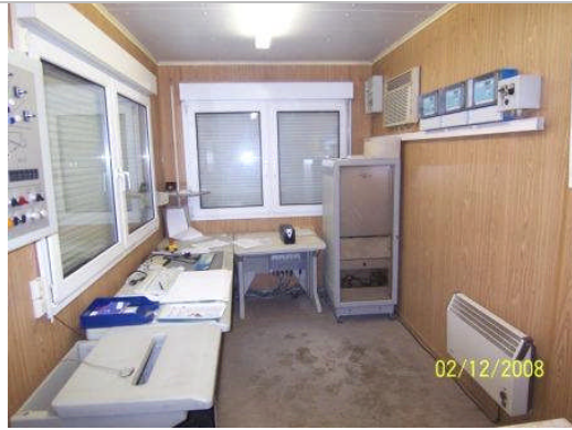
Steuerung Container von innen