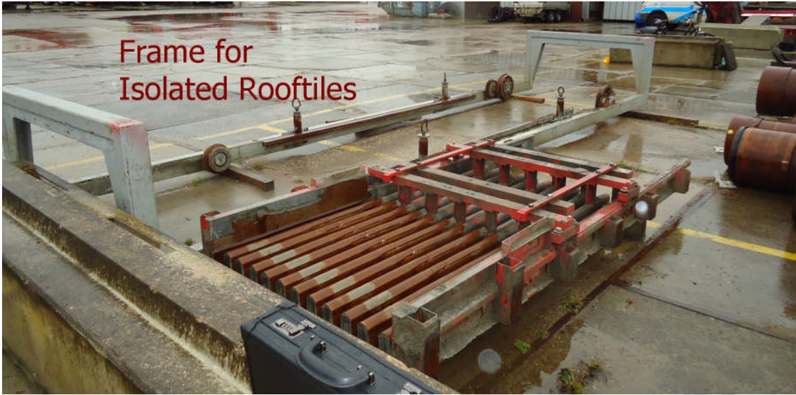
Frame for Isolated Rooftiles